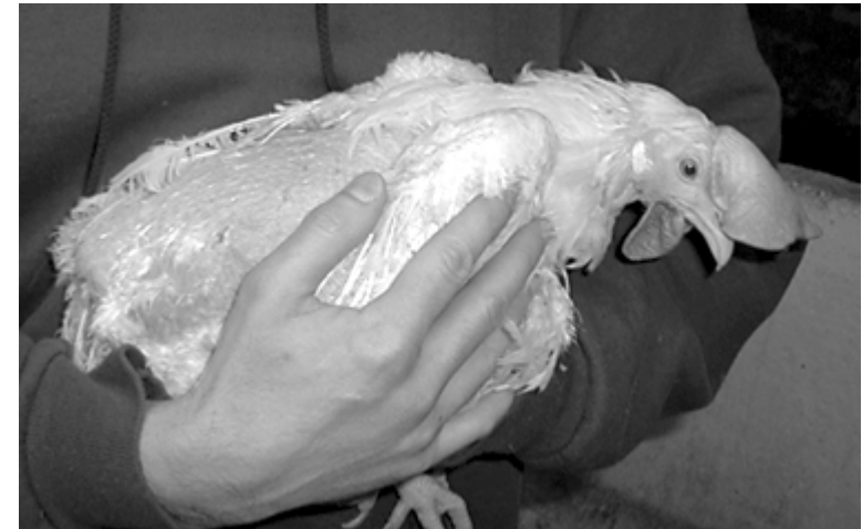
Befriad höna. Fler bilder finns på: http://user.tninet.se/~onn8580